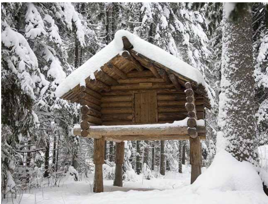
кўрәң лупас – лабаз