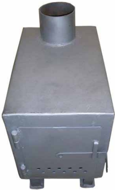
көр – печка