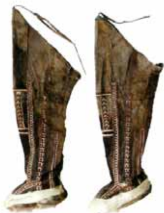
вэй – кИСЫ