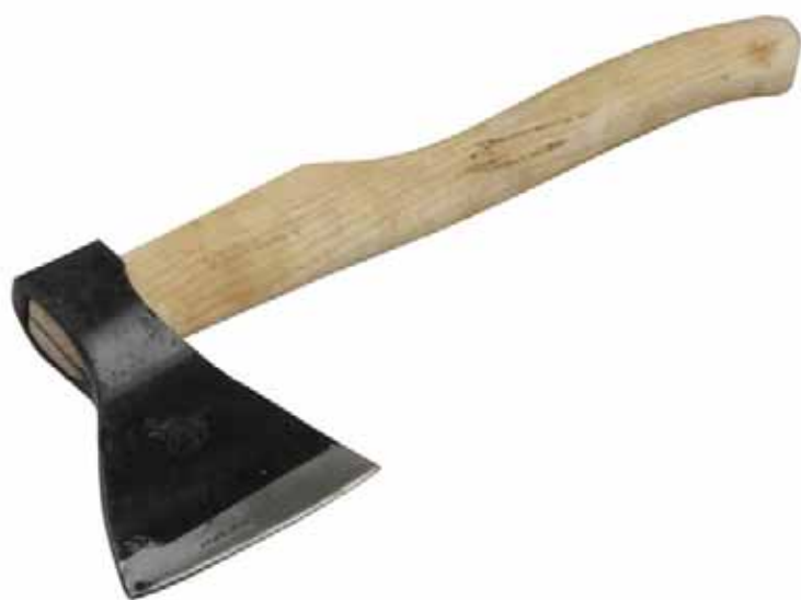
лайэм – топор