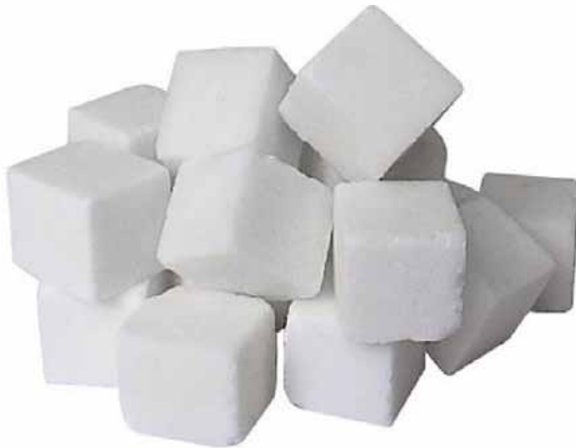
саккар – сахар