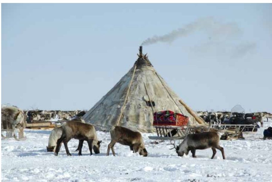
йурэн хот – чум