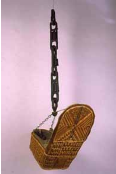
онтэп – колыбель