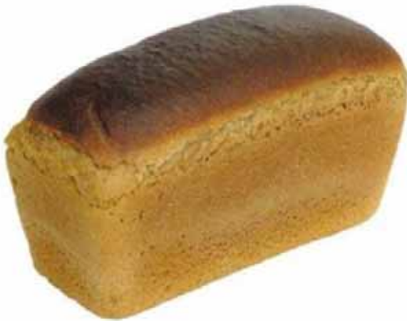
ЊАЊ – ХЛЕБ