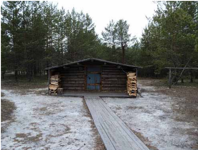
павэрт хот бревенчатый дом