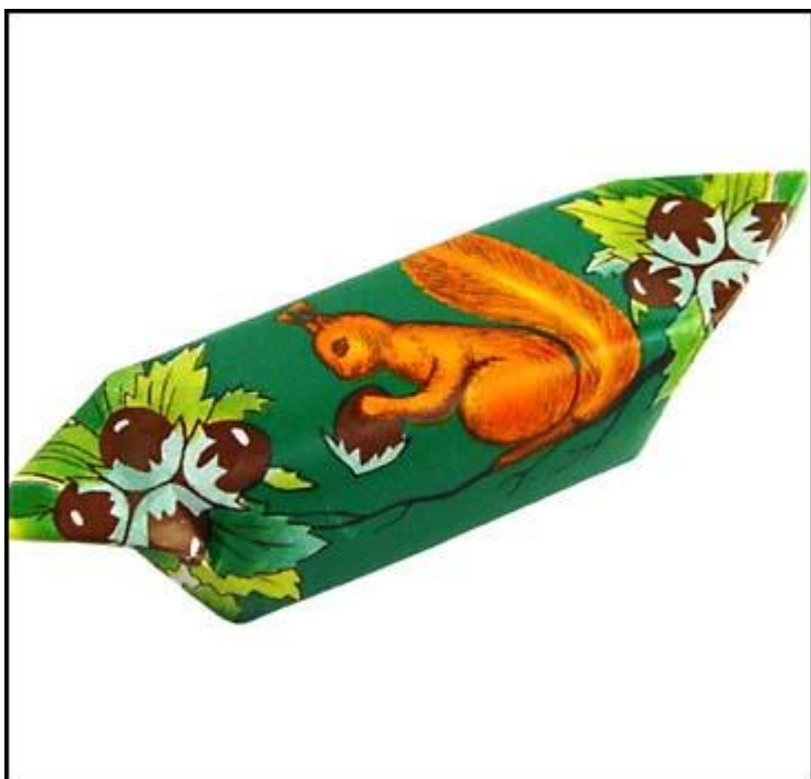
мав – конфета