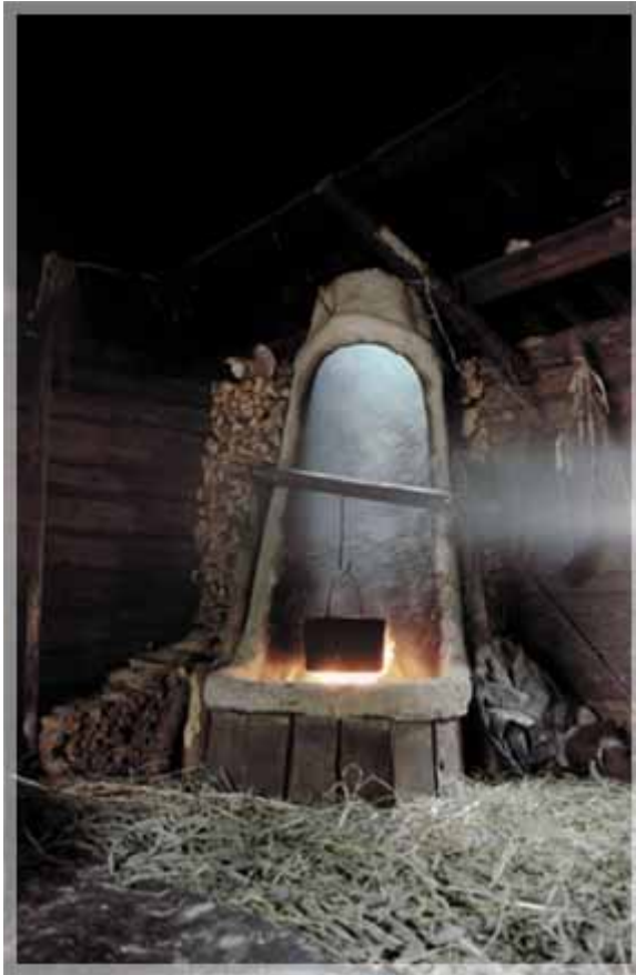
щухал – чувал