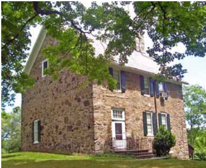
кэв хот каменный дом