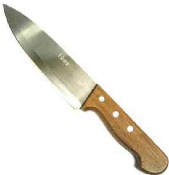
кэши – нож