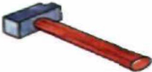
сăҗкәп – молоток