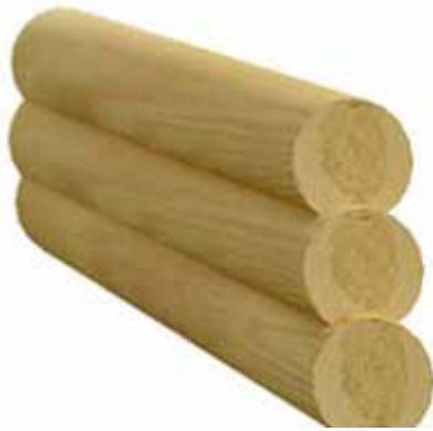
павэрт – бревно