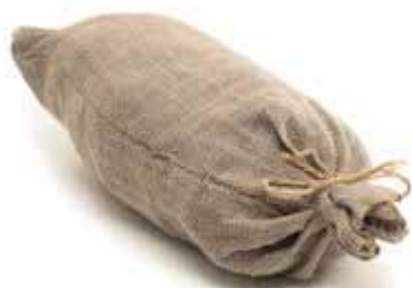
хир – мешок