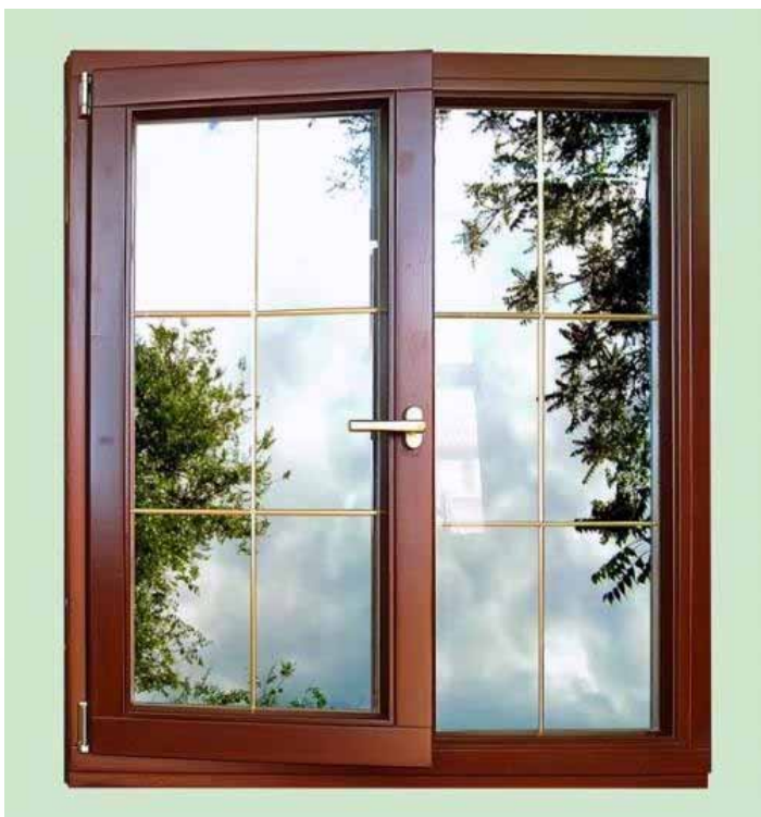
ишњи – окно