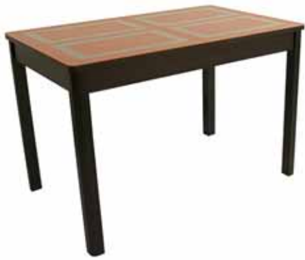
пӑсан – стол