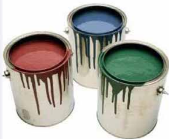
ольѧп – краска