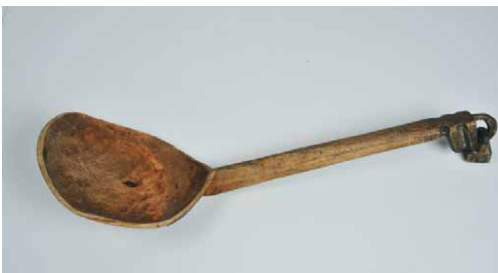
луй – поварешка