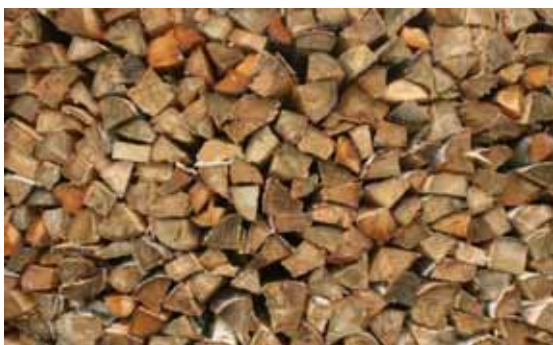
йўх пай – дровяник