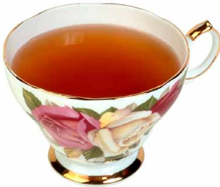
шай – чай