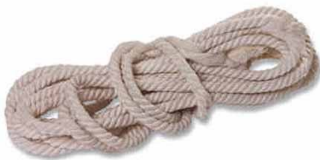
кэж – веревка