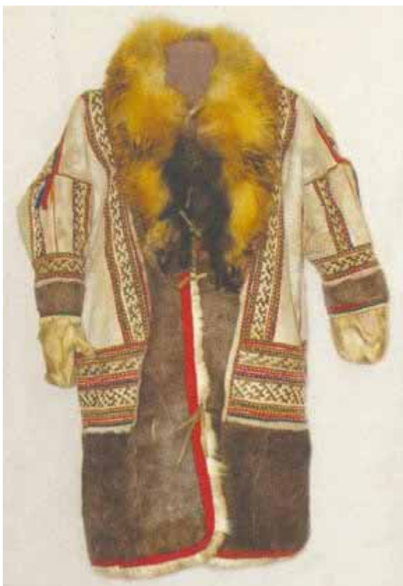
сӓх – шуба (женская)