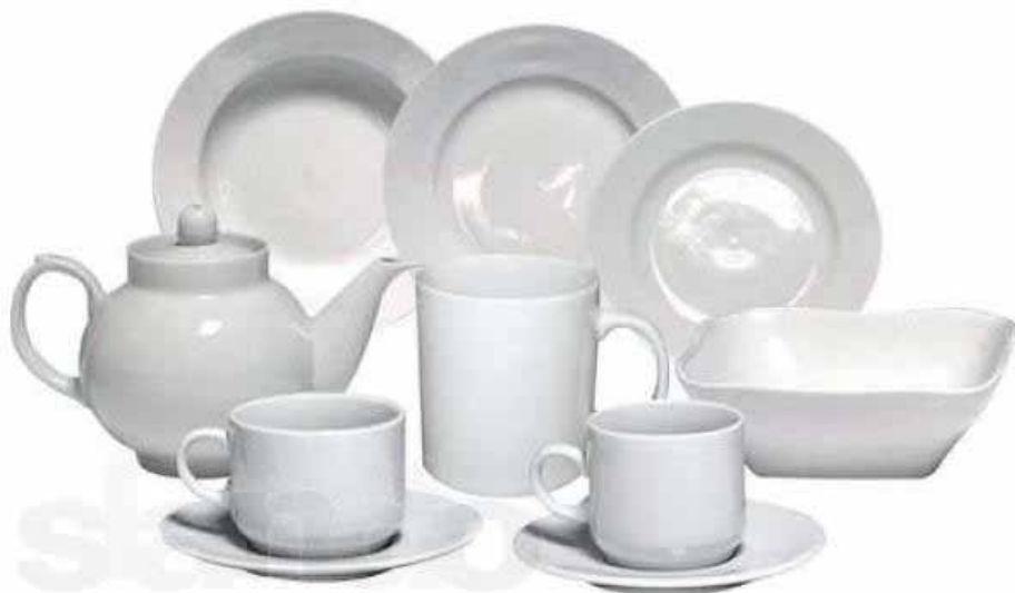
ан-сөн – посуда