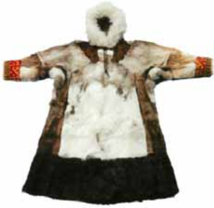
МОЛЭПЦИ – МАЛИЦА