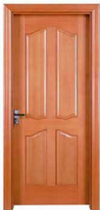
ов – дверь