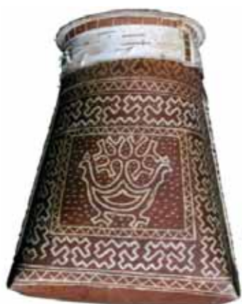
Хинт – кузовок