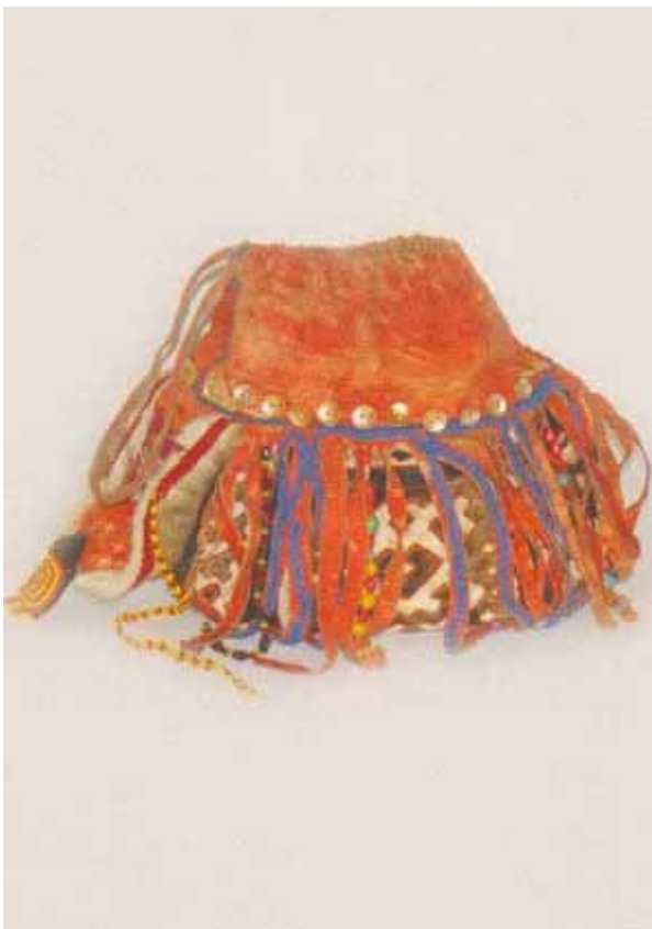
тўтцаң, тўтцаң хир – мешок для