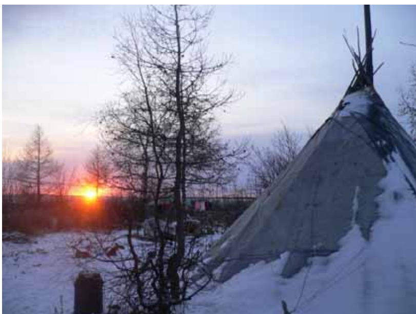
Ѓўки хот – зимний чум