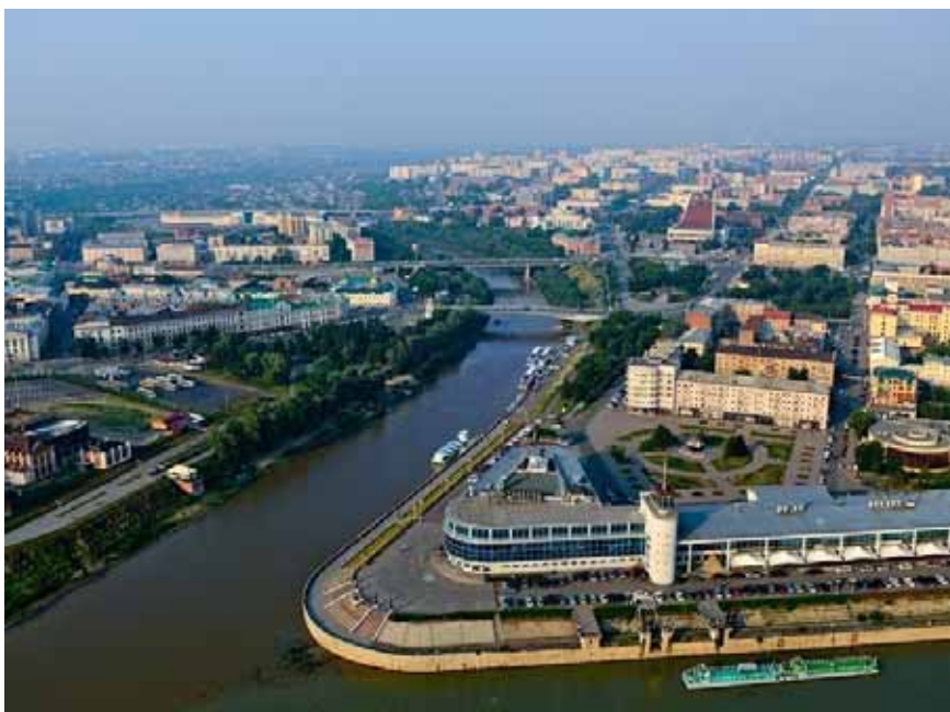
вош – город