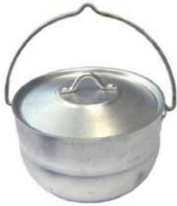
пўт – котёл