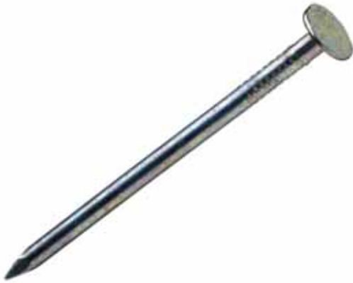
карлуҥк – гвоздь