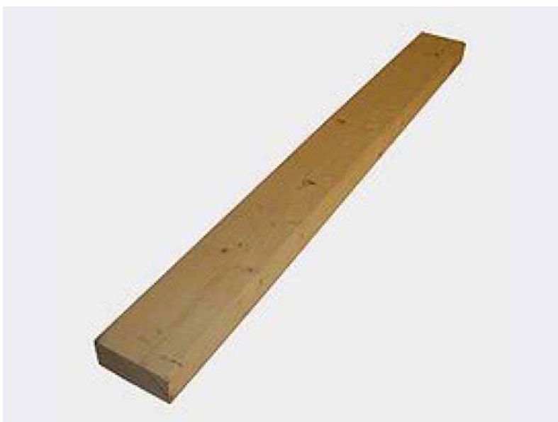
сохӓл – доска