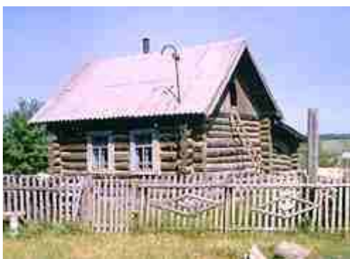
ХОТ – ДОМ