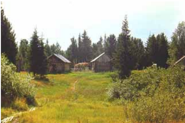
көрт – деревня