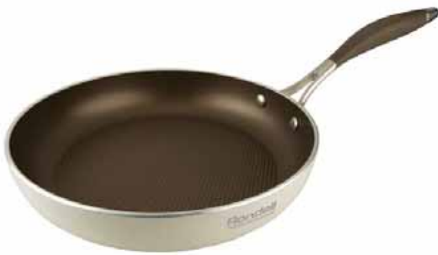
кэв картан – сковородка