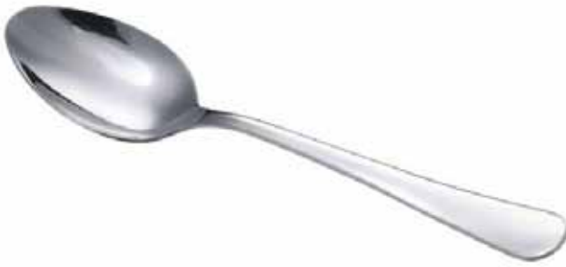
ЊАЛЫ – ЛОЖКА