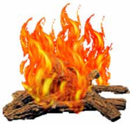
тўт – ОГОНЬ