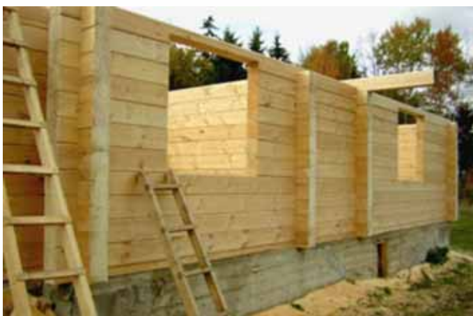
ХОТ ОМЭСТЫ – построить дом