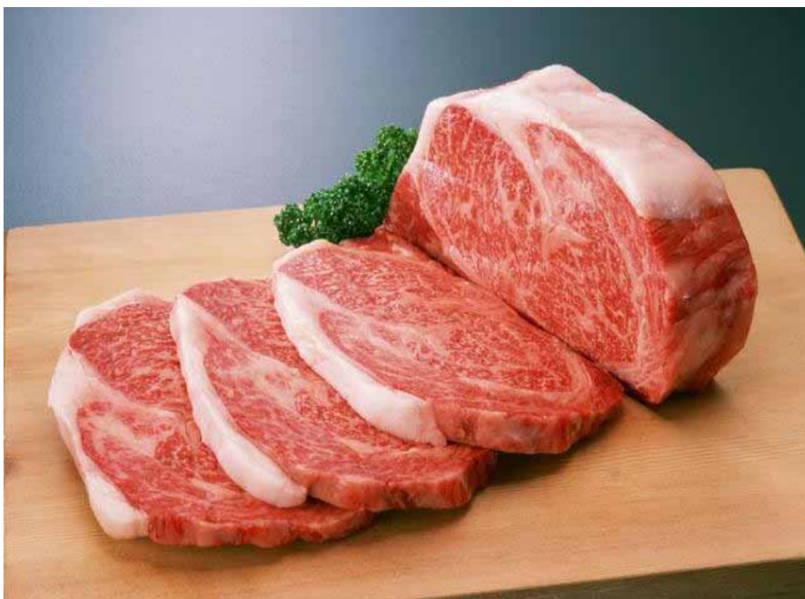
Ѓухи – мясо