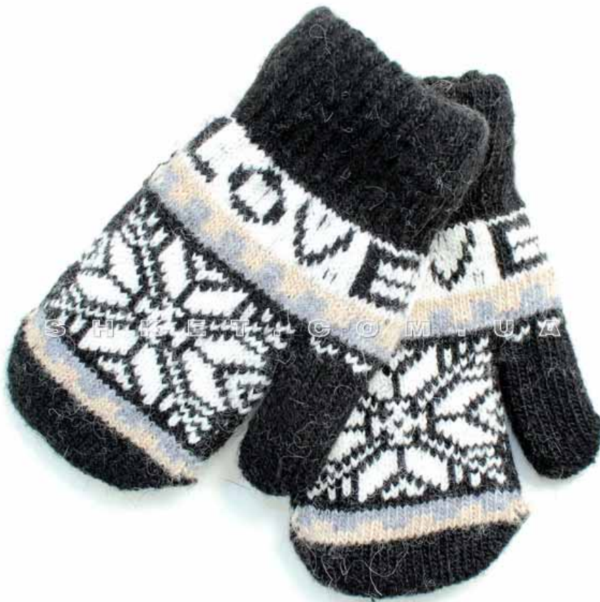
пос – рукавица