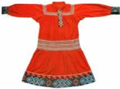
йернас – платье