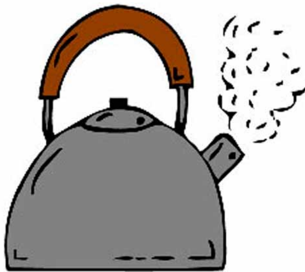
шай пўт – чайник