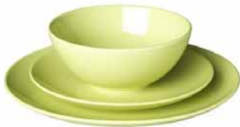
ан – тарелка