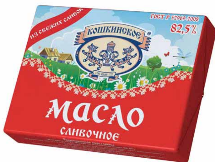
мис вуй – сливочное масло