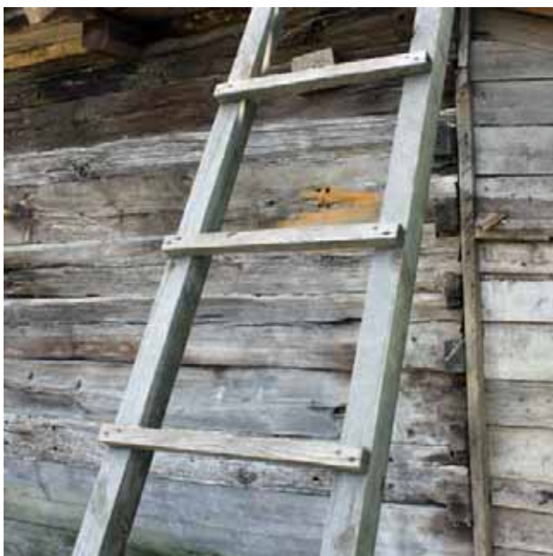
ХОҶТЕП – лестница