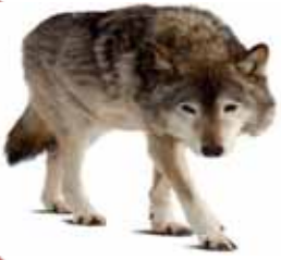
вўлы пурты вой