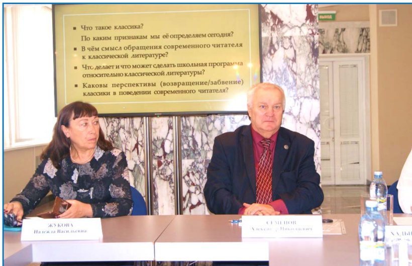
Лекции для слушателей. г. Сургут, 2018г.