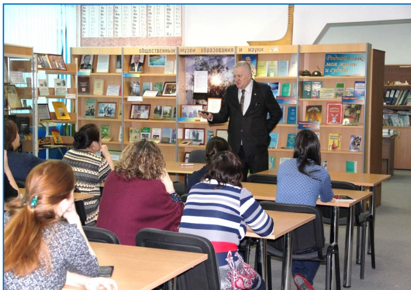
Лекции для сотрудников ОУИПИИР. 2018 г.