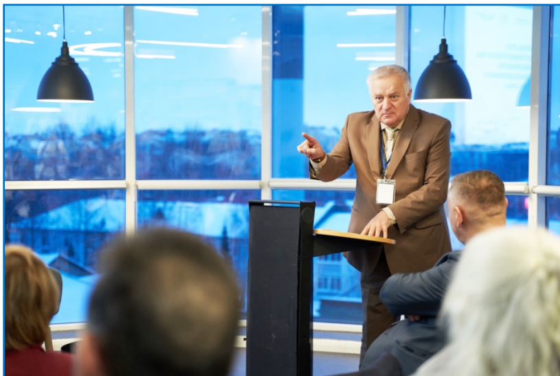
Государственная библиотека Югры, г. Ханты-Мансийск, 2022 г.