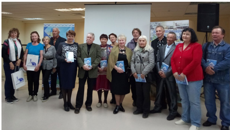
Презентация поэтического сборника местных поэтов Белоярского района «Край любимый Белоярский», 2023 г., г. Белоярский