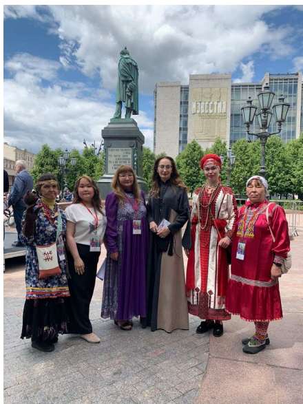
Фестиваль национальных литератур народов России, 2023 г. г. Москва