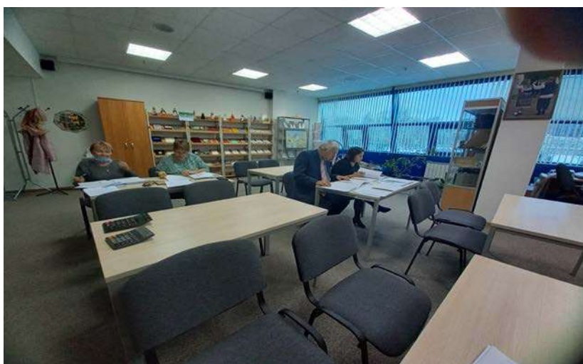
Жюри за работой по проверке выполненных заданий по Олимпиаде