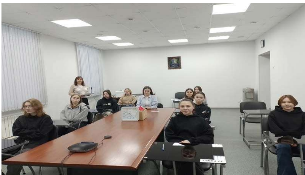
Участники Олимпиады Ханты-Мансийского технолого-педагогического колледжа 2023 г.