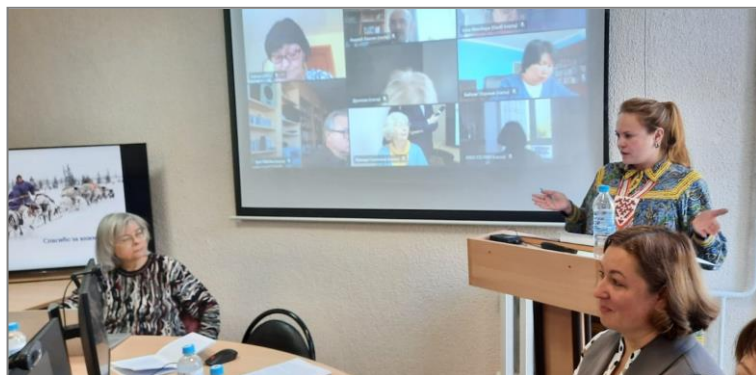
Защита диссертации на соискание ученой степени кандидата филологических наук, 2022