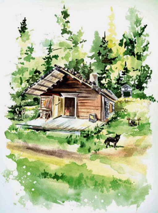
Вõрхум п̄авылт В деревне охотника

Вõрхум п̄авылт = В деревне охотника (мансийская народная сказка) / сост., пер. на рус. яз. С. С. Динисламовой ; ред. манс. текста Т. Д. Слинкина ; пер. на англ. текст М. Г. Волдина ; ред. англ. текста О. Ю. Динисламова. – Тюмень : ООО «Формат», 2016. – 16 с. : ил.