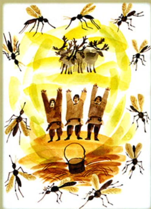
Хутыса пелнайэт саңэнмэсэт Как появились комары

Хутыса пелнайэт са- ңэнмэсэт = Как поя- вились комары / сост. Т. В. Волдина ; литерат. обработка и пер. на рус. яз. М. К. Волдина ; пер. на англ. яз. М. Г. Волди- ной. – Ханты-Ман- сийск : ООО «Югор- ский формат», 2016. – 15 с. : ил.