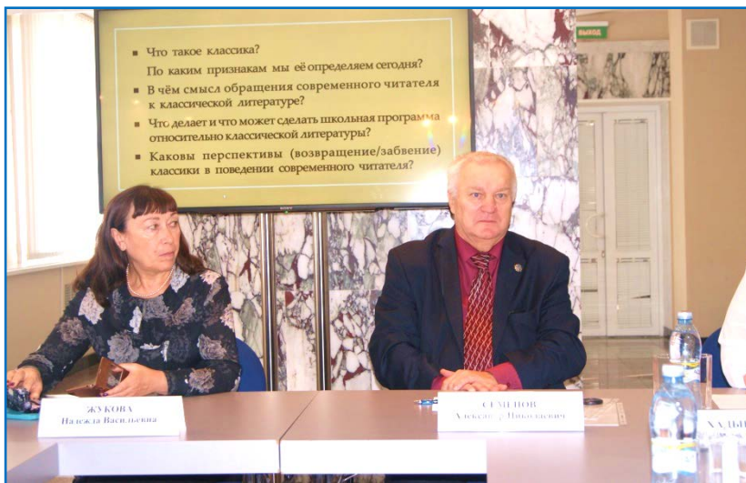
Лекции для слушателей. г. Сургут, 2018г.